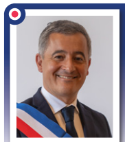
Gérald DARMANIN Premier adjoint en charge de l'urbanisme et des grands projets