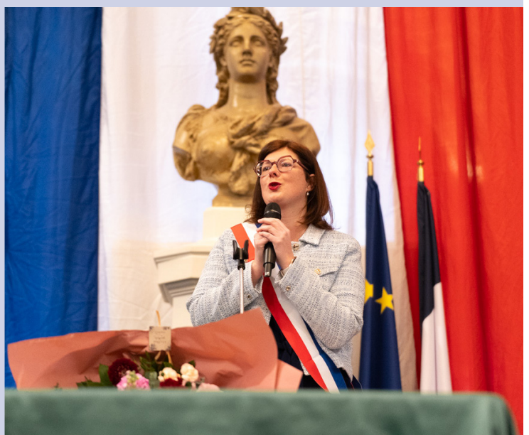
6 Le Maire remet ensuite l'écharpe tricolore à l'ensemble des adjoints. Un moment fort en émotion.