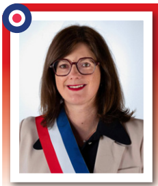
Doriane BÉCUE Maire de Tourcoing