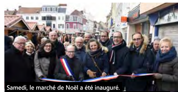
Samedi, le marché de Noël a été inauguré. Pendant deux jours une trentaine de chalets étaient installés autour de la Grand Place. Désormais, le Village de Noël vous attend jusqu'au 31 décembre.