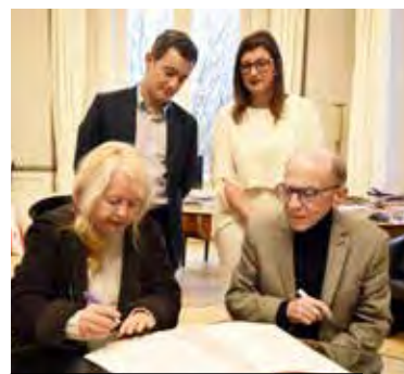
Vendredi dernier, les contrats PEC (Parcours Emploi Compétences) ont été signés dans le bureau du Maire.