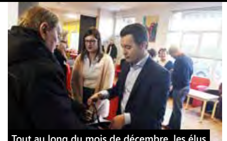
Tout au long du mois de décembre, les élus distribuent les colis de fin d'année aux seniors de Tourcoing ou un chèque cadeau à utiliser chez les commerçants tourquennois.