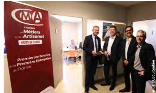
L'antenne tourquennoise de la Chambre des métiers et de l'artisanat a été inaugurée il y a quelques jours au Virolois.

📌 Ouverture : du lundi au vendredi de 8h30 à 12h et de 13h30 à 17h