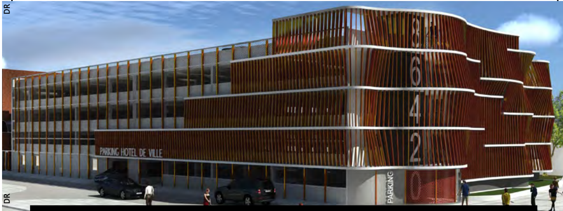
Le Conseil municipal vient d'autoriser les travaux de réhabilitation et d'extension dont fera prochainement l'objet le parking de l'Hôtel de Ville situé rue de la Bienfaisance qui se nommera Parking du Centre.

Enfin, il a également été question de parentalité. En s'inspirant du projet du Gouvernement (la Ministre des Solidarités et de la Santé, Agnès Buzyn a lancé le 2 juillet dernier une stratégie nationale de soutien à la parentalité), la Ville de Tourcoing souhaite développer des actions en matière d'accompagnement à la parentalité des familles tourquennoises pour les années 2019 et 2020. Il a donc été décidé d'accompagner la fonction parentale, de faciliter l'accès à une information claire et à des lieux ressources existants, de soutenir les acteurs accompagnant la fonction parentale, en lien avec les partenaires spécialisés, et de développer l'information des familles sur des thèmes qu'elles ont choisis. ■