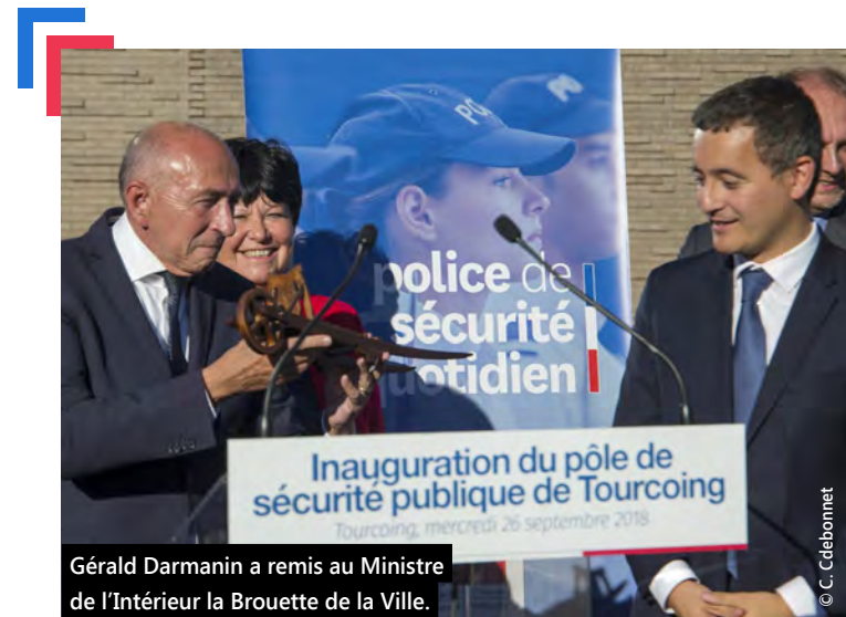
Gérald Darmanin a remis au Ministre de l'Intérieur la Brouette de la Ville.