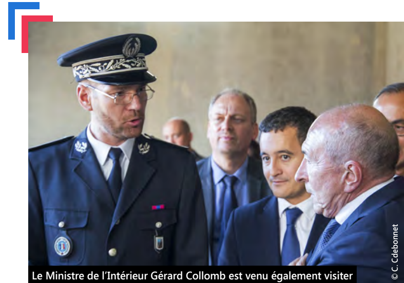
Le Ministre de l'Intérieur Gérard Collomb est venu également visiter le chantier du commissariat de Police Nationale.