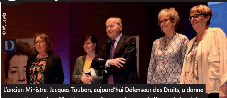
L'ancien Ministre, Jacques Toubon, aujourd'hui Défenseur des Droits, a donné une conférence dans l'Auditorium du Conservatoire sur le thème de la relation des habitants avec les services publics.