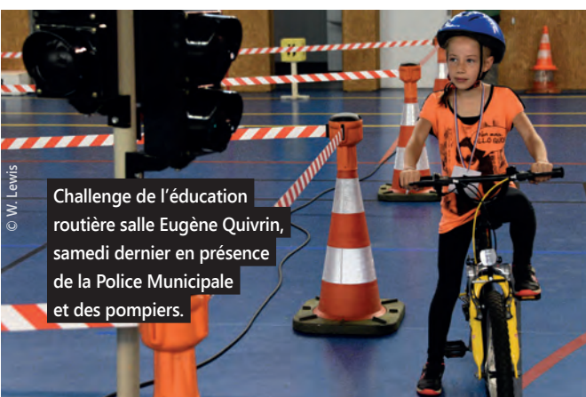
Challenge de l'éducation routière salle Eugène Quivrin, samedi dernier en présence de la Police Municipale et des pompiers.