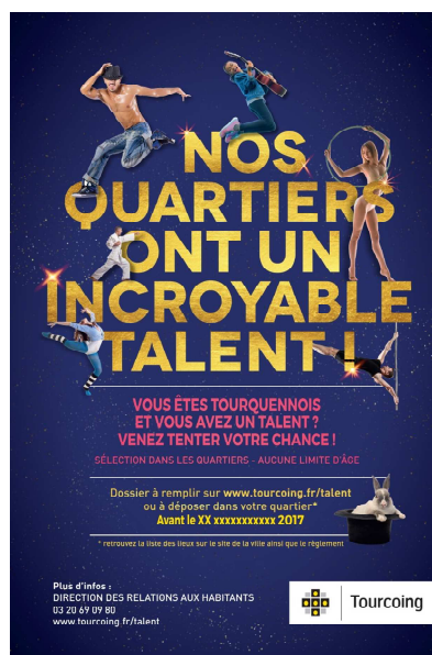
Document de travail

🇫🇷 Un gala final pourrait avoir lieu afin de sélectionner le « talent » tourquennois parmi les 16 préalablement retenus (un par quartier).