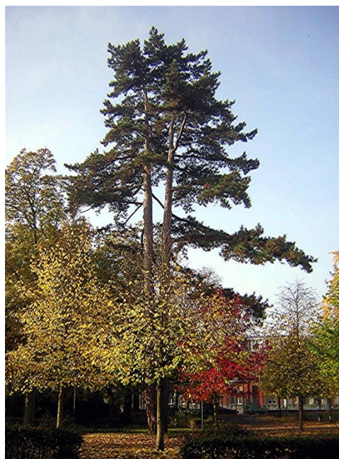
PARC DU BROUTTEUX