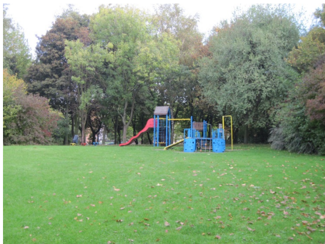
PARC MOULIN TONTON