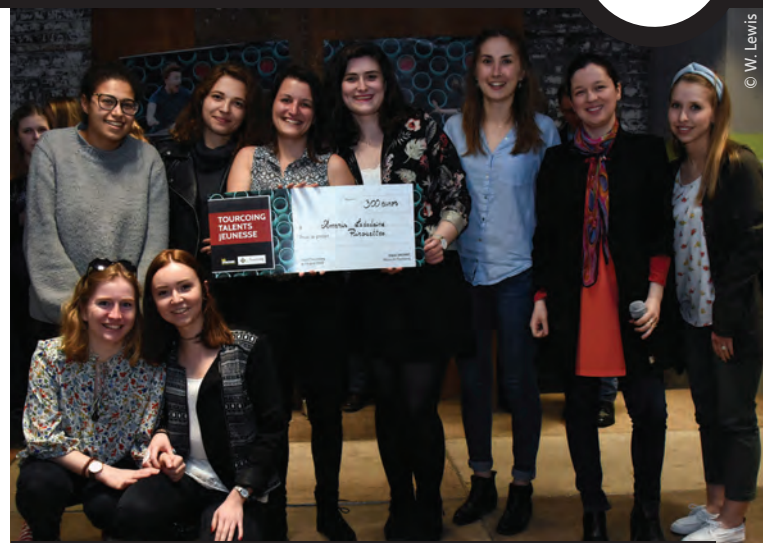
Samedi les lauréats de Tourcoing Talents Jeunesse ont été récompensés à l'Atelier. Tout le palmarès sur : www.tourcoing.fr/tj