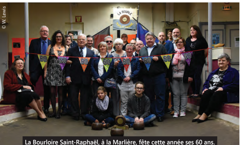
La Bourloire Saint-Raphaël, à la Marlière, fête cette année ses 60 ans.