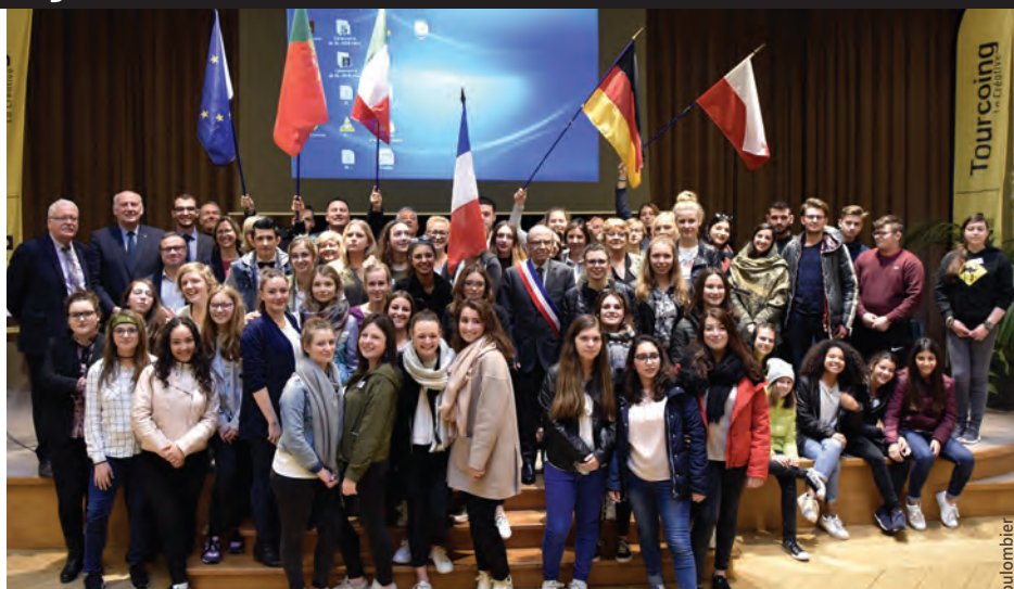
Une cinquantaine de lycéens italiens, allemands, polonais et portugais ont été reçus à l'Hôtel de Ville dans le cadre du projet ERASMUS + du lycée Marie Noël.