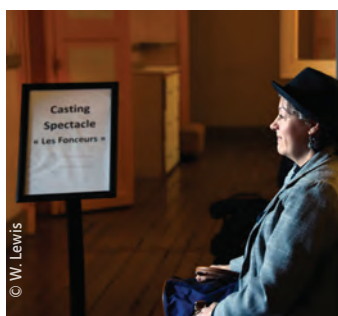
Le casting pour le spectacle événement, dans le cadre des commémorations de la Première Guerre mondiale, s'est déroulé le week-end dernier à l'Hôtel de Ville. Les « apprentis comédiens » sélectionnés seront sur scène au mois de septembre !