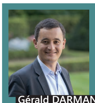
Gérald DARMANIN Maire de Tourcoing