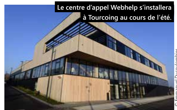
Le centre d'appel Webhelp s'installera à Tourcoing au cours de l'été.

Les recrutements sont prévus dans les semaines à venir. C'est le cas notamment des futurs superviseurs (ayant deux années d'expérience dans le management), et d'une trentaine de chargés de relation clients. Ces derniers devront être à