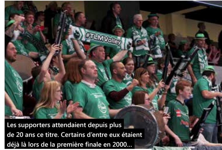
Les supporters attendaient depuis plus de 20 ans ce titre. Certains d'entre eux étaient déjà là lors de la première finale en 2000...