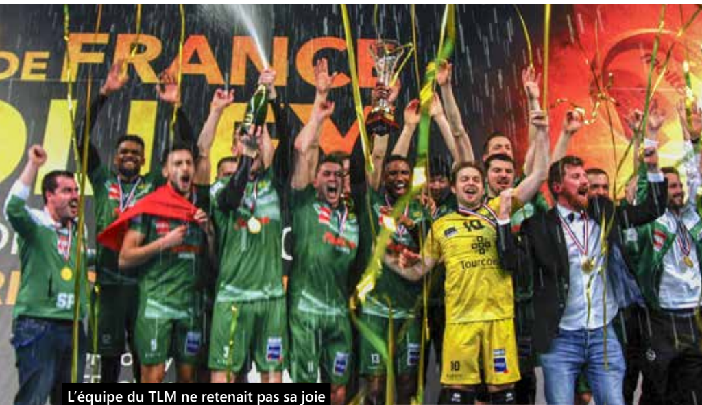
L'équipe du TLM ne retenait pas sa joie lors de cette victoire tant attendue.