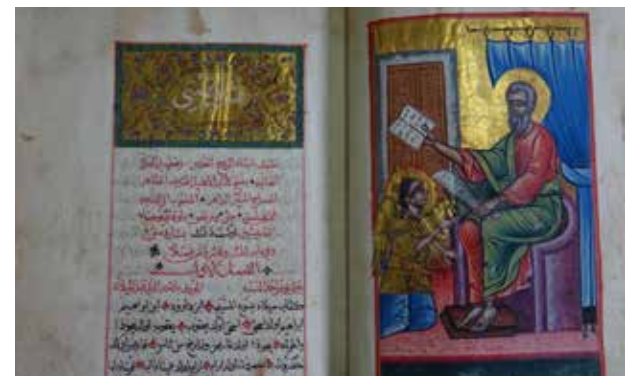
© Évangile arabe - Enluminé par Ne'meh al-Musawwir (attrib.) Syrie, 1675 - Beyrouth, Collection Antoine et Janine Maamari

Depuis le 23 février, l'exposition événement « Chrétiens d'Orient : 2000 ans d'histoire » est lancée ! Jusqu'au 11 juin 2018, venez découvrir les trésors du patrimoine chrétien oriental au MUBa Eugène Leroy, musée des Beaux-Arts de la Ville de Tourcoing. Retour sur une nouvelle œuvre présente dans l'exposition. Cet évangile arabe, datant du XVII e siècle, fait partie des nombreuses œuvres symbolisant le développement de la littérature chrétienne de l'époque en langue arabe. L'objectif de ces écrits était alors à la fois d'expliquer la foi chrétienne et d'en défendre la vérité, mais également d'arbitrer des débats controversés entre les différentes Religions. ■