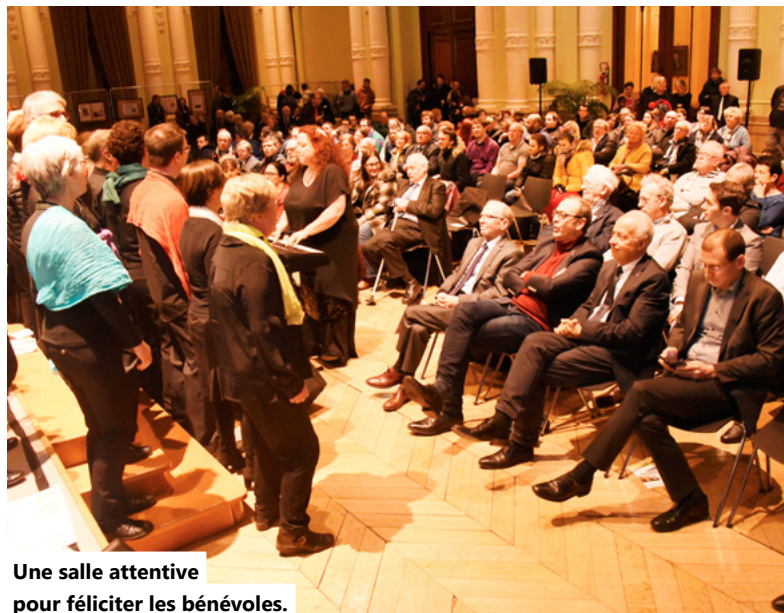
Une salle attentive pour féliciter les bénévoles.