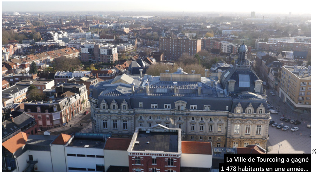
La Ville de Tourcoing a gagné 1 478 habitants en une année...

📍 RS Coiffure - 9 rue de Tournai ☎ 03 20 26 23 42 📱 RibeiroStephanieCoiffure