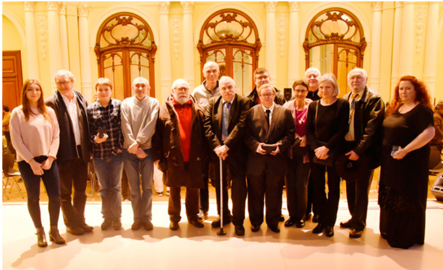
L'ensemble des lauréats de l'édition 2018.