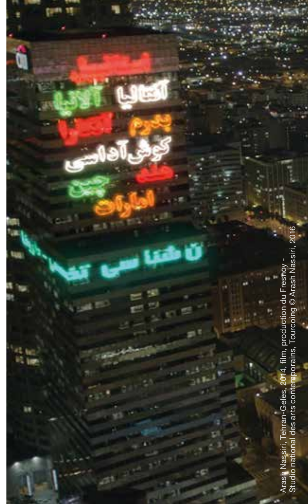
Arash Nassiri, Tenran-Geles, 2014, film, production du Fresnoy - Studio national des arts contemporains, Tourcoing

17 sept. : Pierre PLOUVIER 18 sept. : Jean DELANNOY