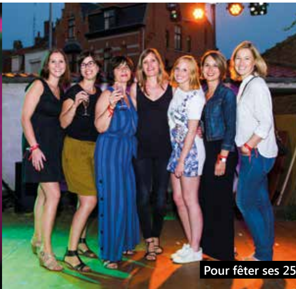
Pour fêter ses 25 ans, l'agence 4 e Dimension devient la 4D...