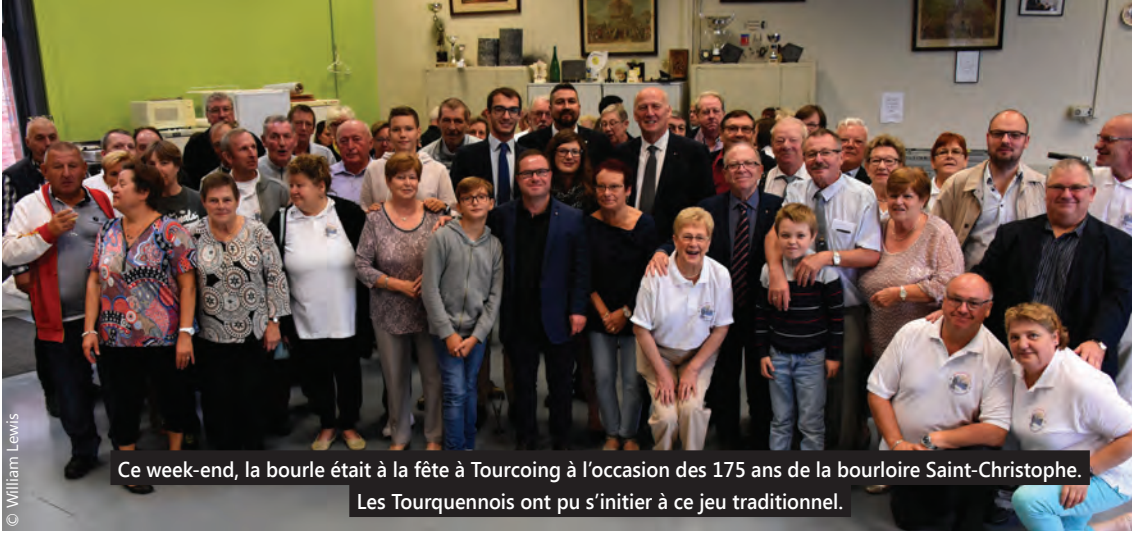
Ce week-end, la bourle était à la fête à Tourcoing à l'occasion des 175 ans de la bourloire Saint-Christophe. Les Tourquennois ont pu s'initier à ce jeu traditionnel.