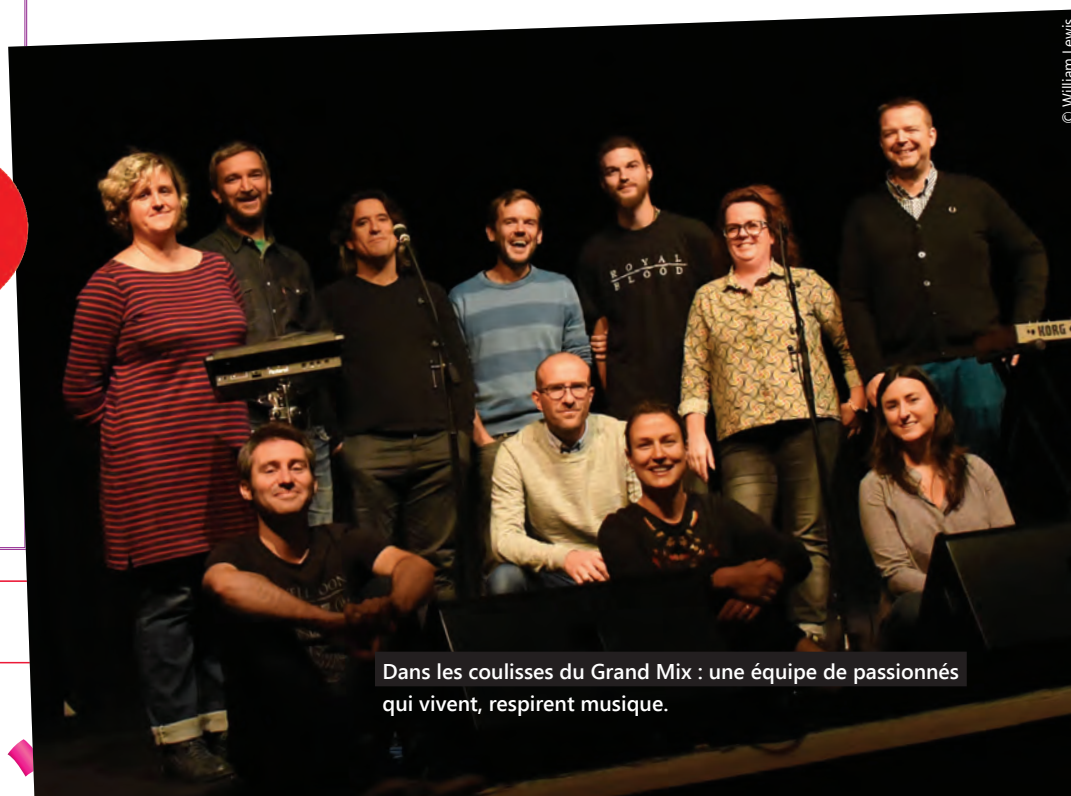
Dans les coulisses du Grand Mix : une équipe de passionnés qui vivent, respirent musique.