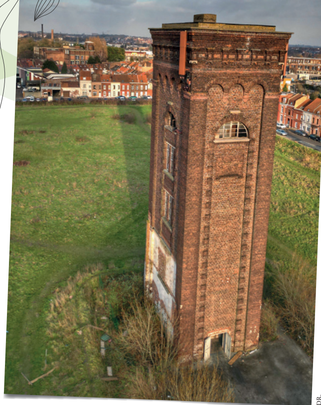
La tour, vestige de l'ancienne usine, emblème du site.