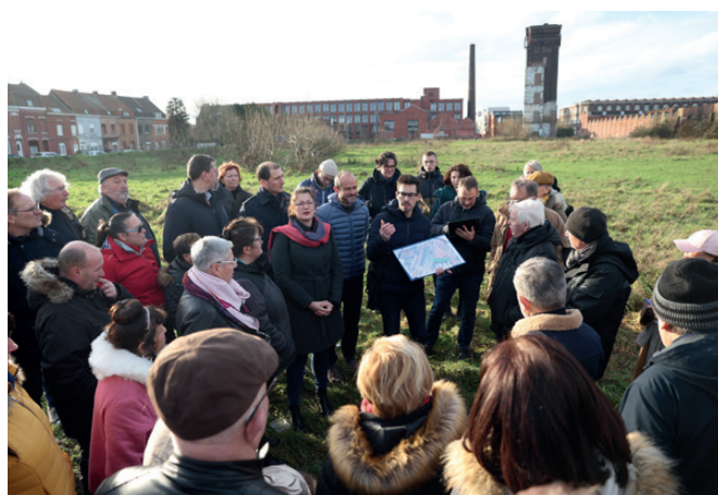
Visite du site avec les habitants du quartier.

Depuis le début de l'année, des ateliers ont ainsi été proposés par un paysagiste afin de co-construire le futur espace. Après avoir découvert (ou redécouvert) le terrain et avoir échangé sur les enjeux du projet, il a été proposé aux riverains d'imaginer le « parc idéal ».