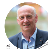
Doriane Bécue Maire de Tourcoing