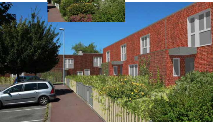
Tandem + - Nortec