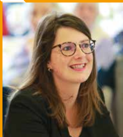
Doriane BECUE, Maire de Tourcoing

La Bourgogne connaît depuis plusieurs mois une intense activité qui témoigne de la métamorphose en cours : réhabilitations de 204 logements, construction de l'équipement commercial et de services, premiers travaux sur le site Lepoutre-La Redoute, poursuite des déconstructions des logements devenus vétustes et inadaptés.