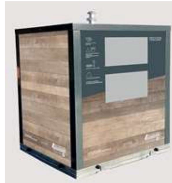
LES ORDURES MENAGERES