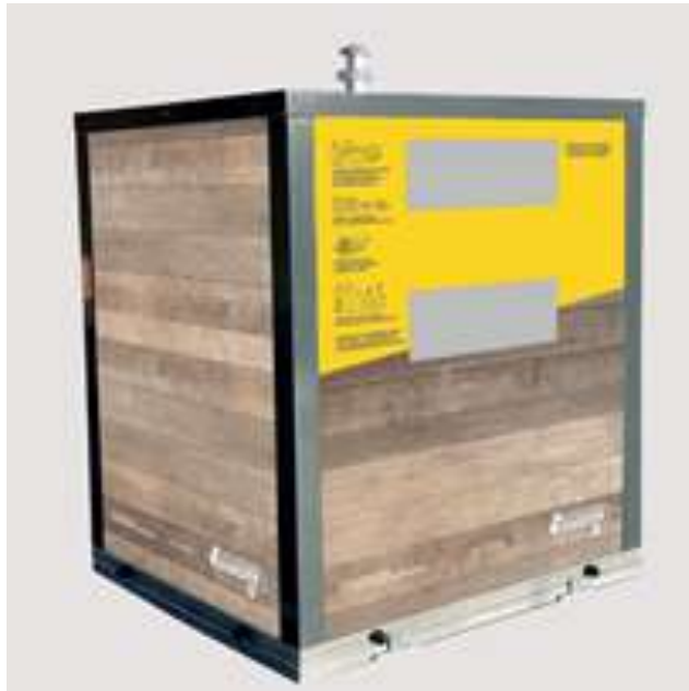
LES DECHETS RECYCLABLES