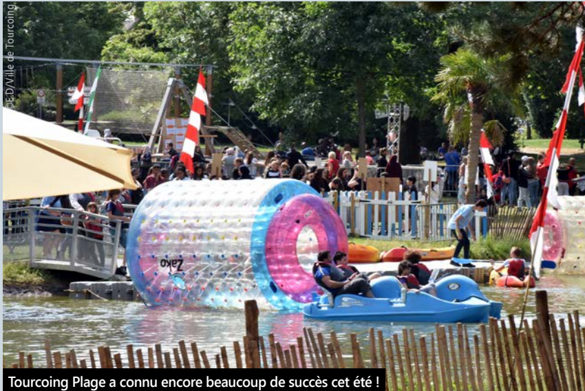
Tourcoing Plage a connu encore beaucoup de succès cet été !