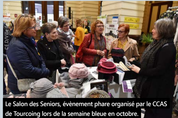
Le Salon des Seniors, événement phare organisé par le CCAS de Tourcoing lors de la semaine bleue en octobre.