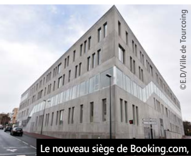
Le nouveau siège de Booking.com, rue des Cinq voies.

« Ma première pensée est bien évidemment pour notre cher ami Didier Droart »