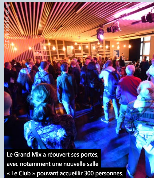
Le Grand Mix a réouvert ses portes, avec notamment une nouvelle salle « Le Club » pouvant accueillir 300 personnes.