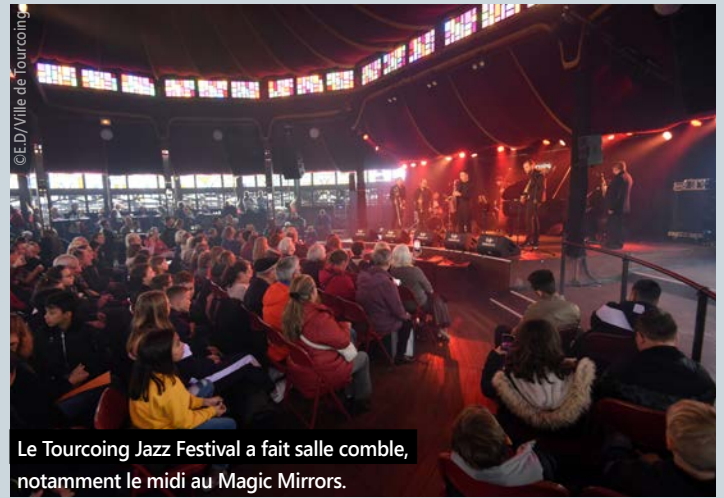
Le Tourcoing Jazz Festival a fait salle comble, notamment le midi au Magic Mirrors.