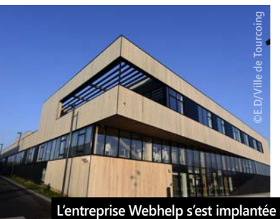
L'entreprise Webhelp s'est implantée en 2019 à Tourcoing.

« Croiser chaque jour des Tourquennois fiers de leur Ville me rend heureux »