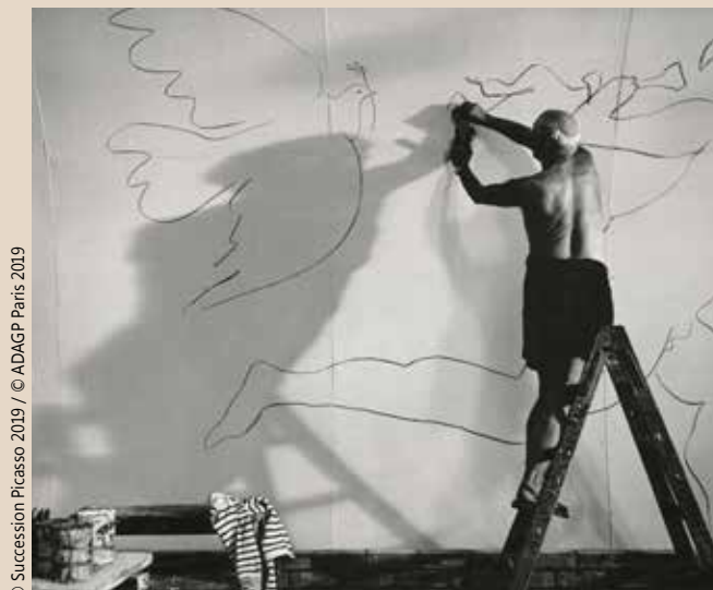
© Succession Picasso 2019 / © ADAGP Paris 2019

Tarif : 8 €, 5,50 € (réduit), 1 € pour les Tourquennois, gratuit pour les moins de 18 ans.