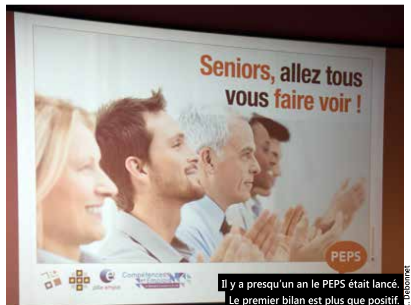
Il y a presque un an le PEPS était lancé. Le premier bilan est plus que positif.