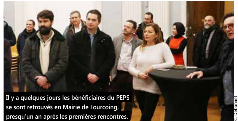
Il y a quelques jours les bénéficiaires du PEPS se sont retrouvés en Mairie de Tourcoing, presque un an après les premières rencontres.