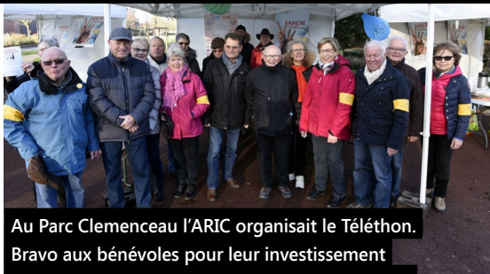
Au Parc Clemenceau l'ARIC organisait le Téléthon. Bravo aux bénévoles pour leur investissement pour aider les personnes atteintes de myopathie.