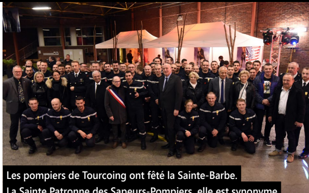
Les pompiers de Tourcoing ont fêté la Sainte-Barbe. La Sainte Patronne des Sapeurs-Pompiers, elle est synonyme de festivités et de convivialité. Fêtée le 4 décembre, elle permet de rendre hommage au travail exigeant et complexe des Sapeurs-Pompiers.