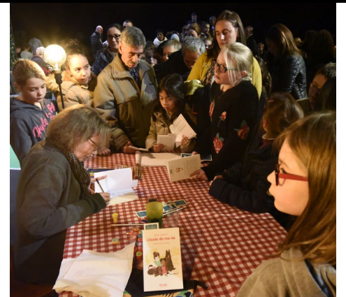
La première distribution de livres de l'année scolaire dans le cadre de l'opération « Un Livre, un enfant » a eu lieu mercredi dernier en présence de l'auteure Marie Desplechin.