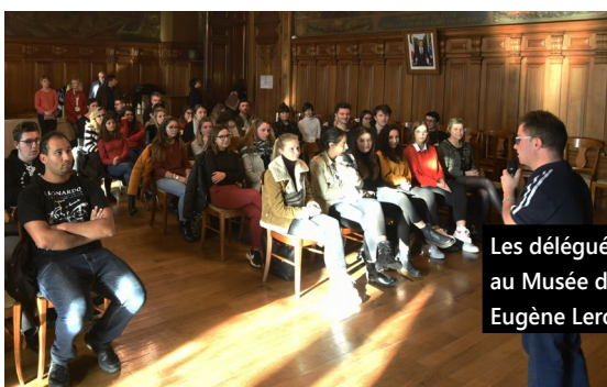
Les délégués des collèges et lycées ont été reçus en Mairie, au Musée des Beaux-Arts de la Ville de Tourcoing, le MUba Eugène Leroy et au Conservatoire.