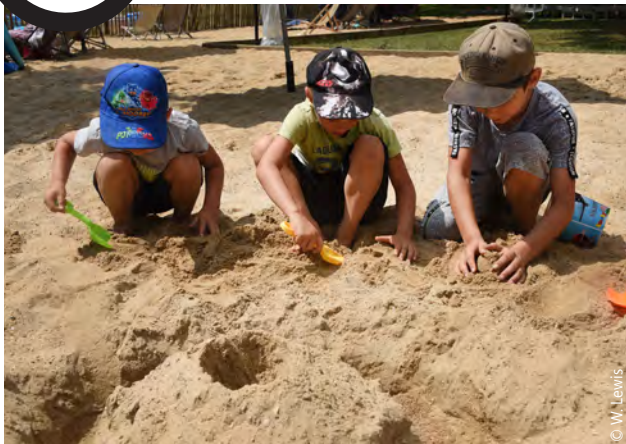
Le millésime 2018 de Tourcoing Plage aura sans doute été un des plus beaux avec une météo exceptionnelle, avec 82 000 visiteurs.