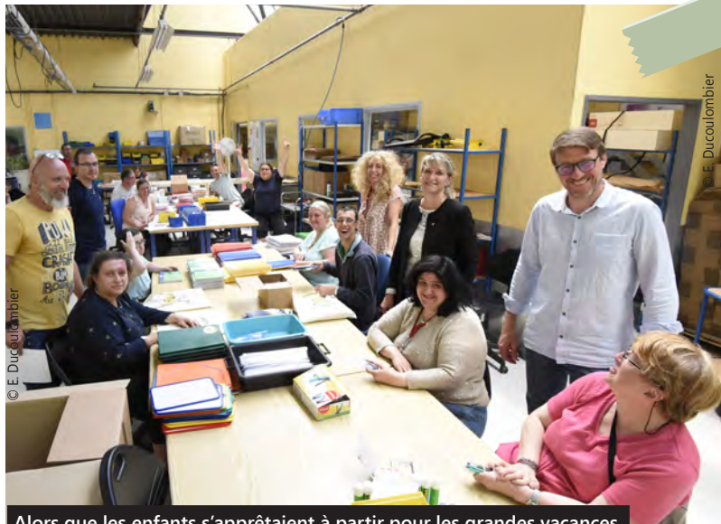
Alors que les enfants s'apprêtaient à partir pour les grandes vacances, à l'ESAT du Roitelet, on s'est attelé à préparer leur rentrée.

« Cette année, une attention toute particulière a été portée sur les kits de fournitures. Ils se veulent pratiques et ludiques. L'éducation est une priorité pour notre Ville et nous agissons au quotidien en ce sens.