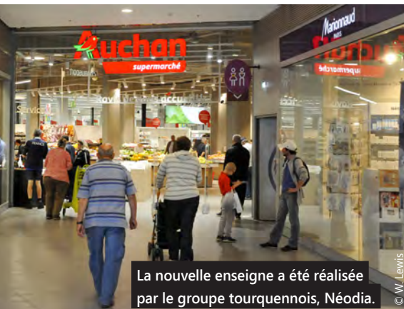
La nouvelle enseigne a été réalisée par le groupe tourquennois, Néodia.