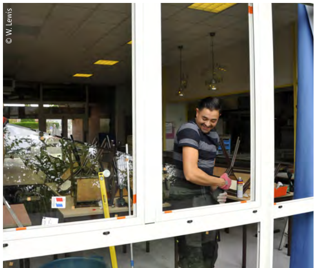
Les investissements dans les écoles se sont poursuivis tout au long de l'été avec des nombreux travaux réalisés afin de rendre plus agréable le quotidien des petits Tourquennois.