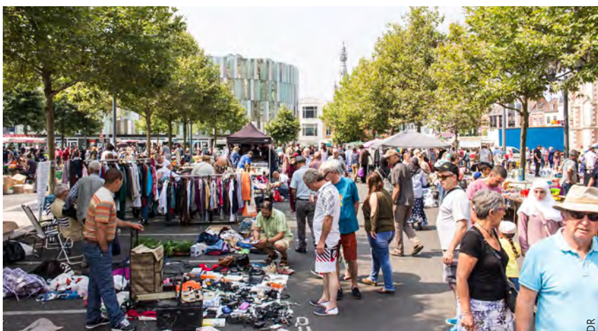
Tout au long de l'été les puces sortent dans les quartiers. Celles du Centre-ville en juillet ont été particulièrement suivies. Retrouvez toutes les dates des puces sur www.tourcoing.fr/Actualites/Calendrier-des-braderies-2018