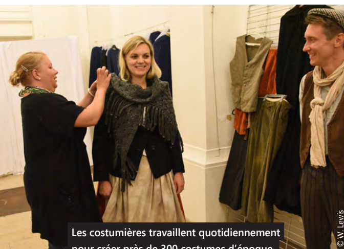
Les costumières travaillent quotidiennement pour créer près de 300 costumes d'époque.

Certains d'entre vous les ont peut-être vus lors des répétitions, notamment sur le parvis Saint-Christophe. Les Fonceurs se préparent. Ils arriveront le 22 septembre à Tourcoing dans un spectacle vivant inédit. Une reconstitution historique sur la vie des Tourquennois pendant la Première Guerre mondiale.