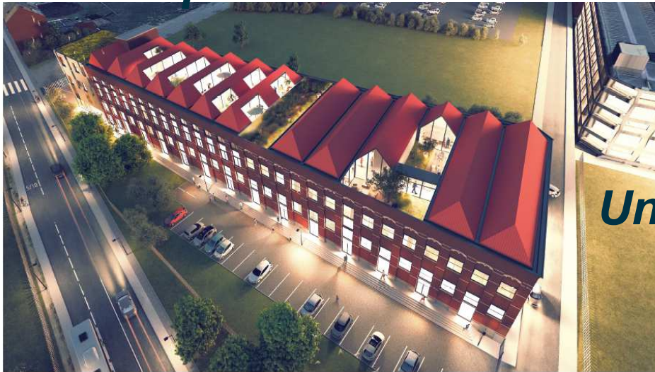
Proposition d'ADIM + VINCI Hornoy Architectes