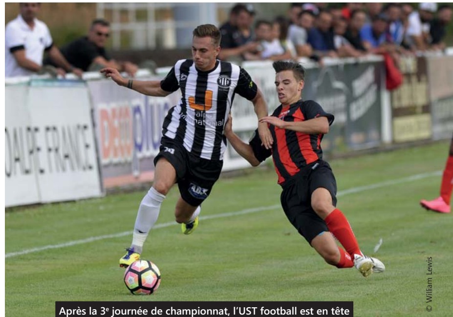
Après la 3 e journée de championnat, l'UST football est en tête du championnat de CFA2 et vient de se qualifier pour le 4 e tour de la Coupe de France.

« Tourcoing est une ville sportive, dont les clubs peuvent compter sur le soutien de la Ville et sur des équipements de qualité. Je souhaite à tous les sportifs qui pratiquent à Tourcoing, dans un petit club de quartier et jusqu'au plus haut niveau, une excellente rentrée ! »