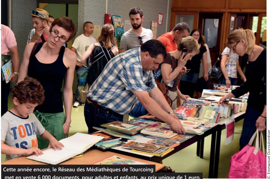
Cette année encore, le Réseau des Médiathèques de Tourcoing met en vente 6 000 documents, pour adultes et enfants, au prix unique de 1 euro.