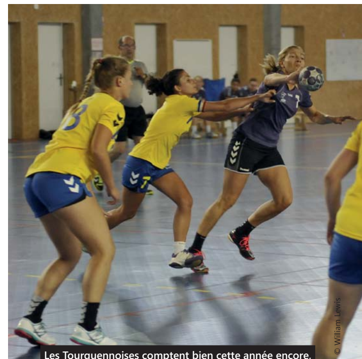
Les Tourquennoises comptent bien cette année encore, faire parler d'elles en Nationale 3.