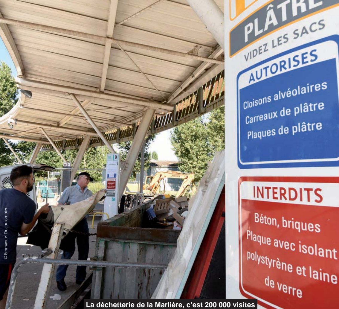
La déchetterie de la Marlière, c'est 200 000 visites et plus de 10 000 tonnes de déchets par an.