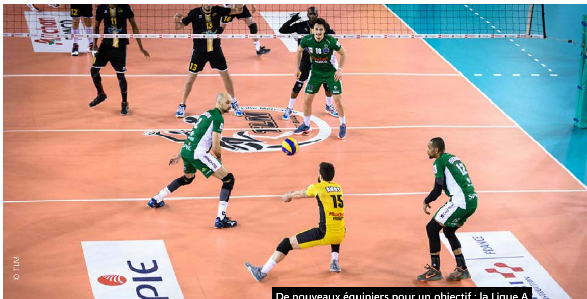
De nouveaux équipiers pour un objectif : la Ligue A