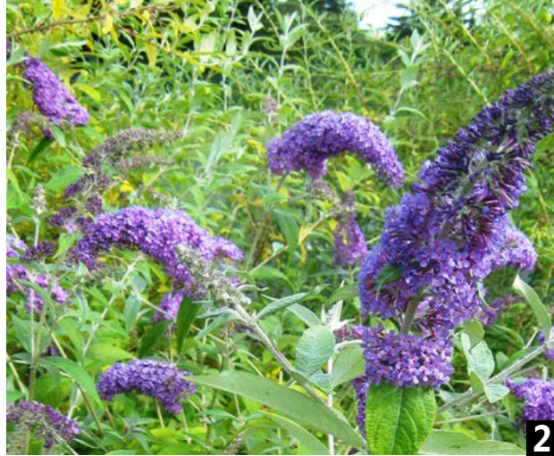
Plante exotique envahissante, la Berce du Caucase ( Heracleum mantegazzianum ) peut provoquer des lésions dermatologiques importantes.

La Ville de Tourcoing, soucieuse d'améliorer le cadre de vie de ses habitants tout en favorisant la biodiversité, lance un plan de lutte contre des plantes considérées comme exotiques envahissantes dans notre région.