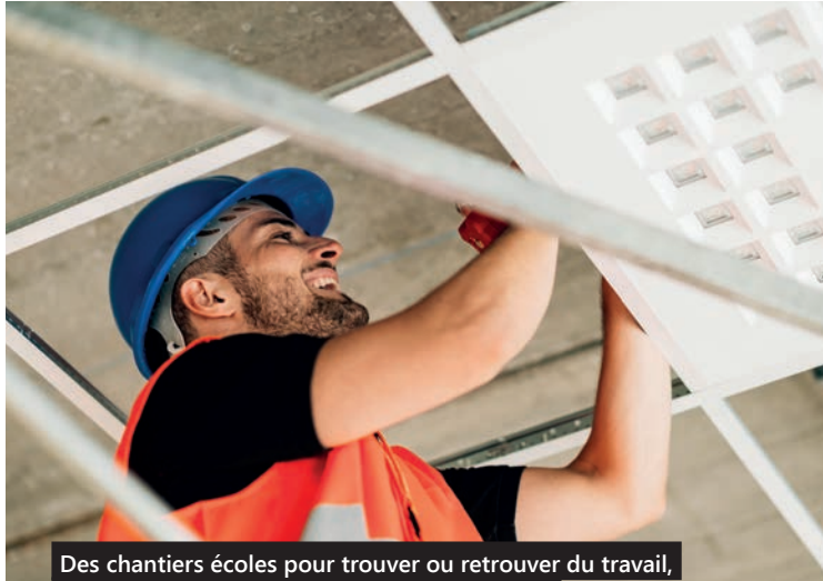
Des chantiers écoles pour trouver ou retrouver du travail, c'est l'objectif de l'association SILEO Bâtiment.

60 contrats à pourvoir d'ici la fin de l'année ? C'est l'ambition de SILEO Bâtiment, l'association du centre social Phalempins-Belencontre, qui propose des chantiers écoles. Une occasion à ne pas manquer !