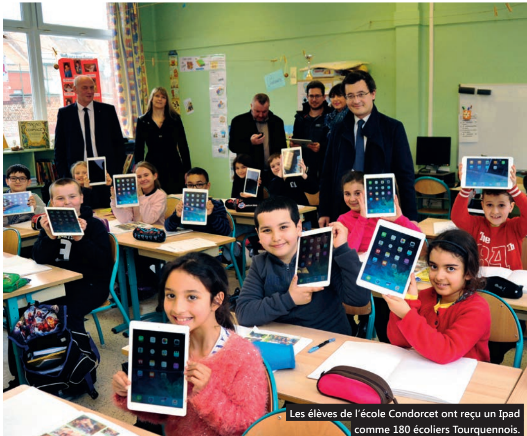
Les élèves de l'école Condorcet ont reçu un Ipad comme 180 écoliers Tourquennois.

A u cours du mois de mars, 180 Ipad ont été distribués par la municipalité aux élèves des classes de CM2 de six écoles de Tourcoing.