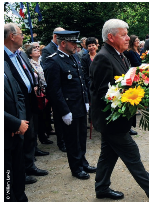
Le député accompagne également le Maire Gérald DARMANIN lors de cérémonies officielles et patriotiques.