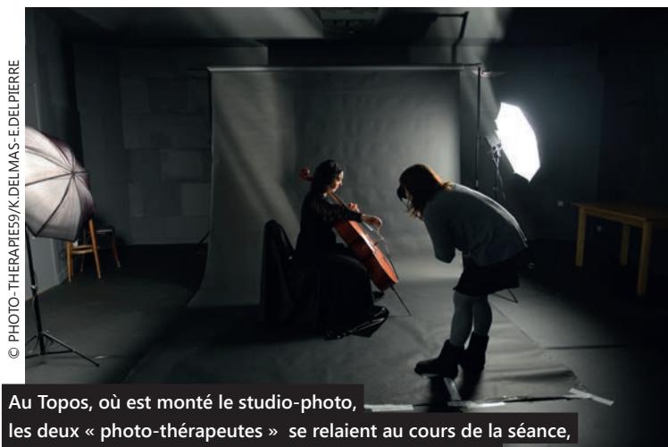
Au Topos, où est monté le studio-photo, les deux « photo-thérapeutes » se relaient au cours de la séance, embrassant leurs modèles de leurs regards bienveillants.

« Le challenge, c'est que les modèles s'aiment. »