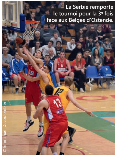
La Serbie remporte le tournoi pour la 3 e fois face aux Belges d'Ostende.

Lors du week-end de Pâques, Tourcoing se transforme traditionnellement en capitale mondiale du basket avec le tournoi de la Jeune Garde. Retour sur cet événement sportif un peu particulier cette année.