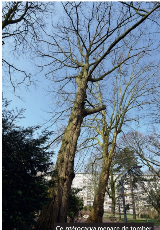
Ce ptérocarya menace de tomber

Si la Direction des Parcs et Jardins et des Espaces Extérieurs, dans le cadre de son travail sur la gestion du patrimoine arboré, s'efforce de garantir une gestion durable de l'arbre en ville, il lui incombe également d'assurer la sécurité des usagers. C'est pourquoi des contrôles de tenue mécanique des arbres sont régulièrement effectués. En 2015, un ptérocarya du parc Clemenceau a été signalé comme dangereux par l'expert en mission pour la commune. L'arbre a été diagnostiqué avec l'aide d'un tomographe. Cet outil permet de « scanner » l'arbre. La tomographie, c'est-à-dire l'image interne de l'état du bois, a démontré que l'arbre n'a plus que 22 % de bois solide. Conclusion : le spécimen fragilisé menace de tomber. Son abattage est prévu pour le 21 mars.