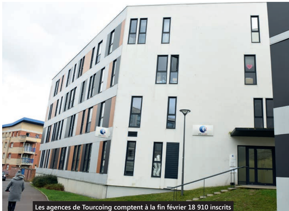
Les agences de Tourcoing comptent à la fin février 18 910 inscrits et enregistrent ou modifient plus de 2 200 dossiers chaque mois.