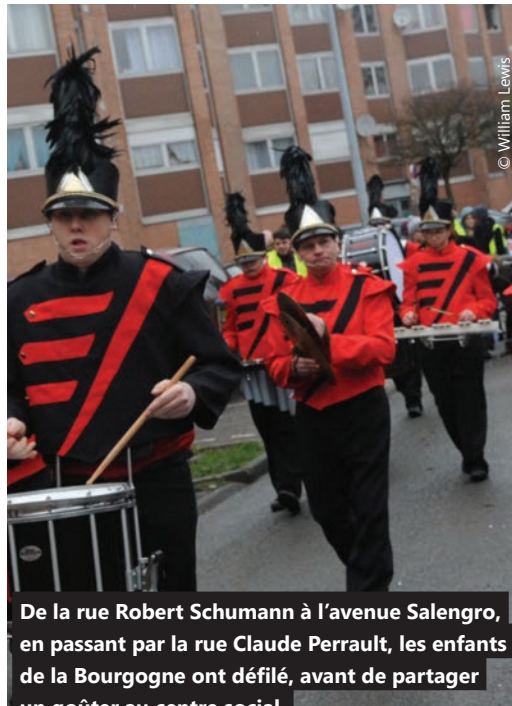
De la rue Robert Schumann à l'avenue Salengro, en passant par la rue Claude Perrault, les enfants de la Bourgogne ont défilé, avant de partager un goûter au centre social. Un moment festif comme on les aime.

Samedi 20 février, pour le départ du défilé, le centre social Bourgogne-Pont de Neuville avait donné rendez-vous aux habitants du quartier à l'école Albert Camus. Tout un symbole. Accompagnés en fanfare par les Tourquennois du Showband Crescendo, ils étaient nombreux à arborer fièrement les couleurs européennes, déguisés ou juste habillés de leur sourire. Sous les masques qu'ils avaient eux-mêmes fabriqués, dans le cadre des ateliers parentalité du centre social, ceux des centres de loisirs, à la ludomédiathèque ou avec les parents d'élèves de Camus, les enfants de 3 à 11 ans avaient du mal à cacher leur joie. « Nous essayons de nouer de plus en plus de liens avec les structures et les établissements scolaires du secteur, pour imaginer des animations ensemble », nous confie-t-on au centre social. Dans cet esprit, un loto est organisé en partenariat avec les classes de 5 e , 4 e et 3 sections européennes du collège