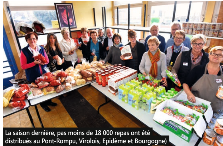
La saison dernière, pas moins de 18 000 repas ont été distribués au Pont-Rompu, Virolois, Epidème et Bourgogne pour plus d'un millier de familles... chaque semaine !

Le centre des Orions Pont-Rompu regroupe une trentaine de bénévoles, dont l'activité ne ralentit pas, hélas. Au contraire, chaque année, le nombre de repas distribués augmente. Et si le centre