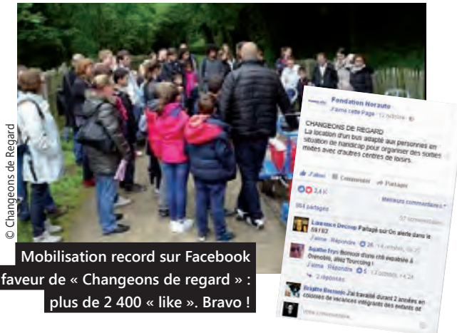
Mobilisation record sur Facebook en faveur de « Changeons de regard » : plus de 2 400 « like ». Bravo !

Ce mardi 15 novembre, l'association tourquennoise, qui gère le centre Loisirs Pluriel, s'est vu remettre, au siège de Norauto à Lesquin, deux trophées : le prix du Public et le 3 e prix du Jury dans la catégorie « Aide à la mobilité ».