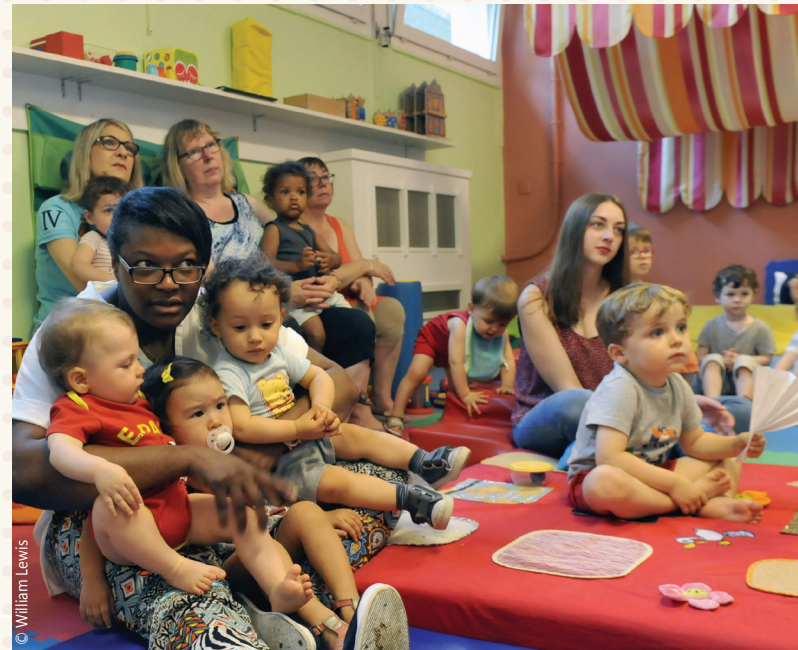
La crèche familiale municipale L'Arc-en-Ciel propose tout au long de l'année des activités autour de la musique, l'éveil à l'art, la motricité... Les enfants sont environ 15 par atelier, encadrés par les assistantes maternelles et l'équipe de la crèche.

assistantes maternelles agrées par le Département du Nord, réparties dans tous les quartiers