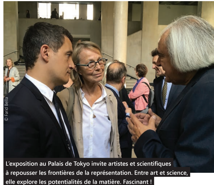
L'exposition au Palais de Tokyo invite artistes et scientifiques à repousser les frontières de la représentation. Entre art et science, elle explore les potentialités de la matière. Fascinant !