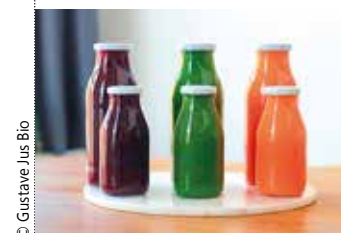
© Gustave Jus Bio

■ Dynamique >p.2 Gustave : des jus bio qui ont du goût