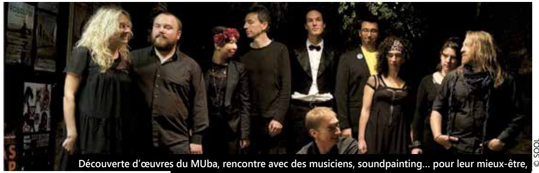
Découverte d'œuvres du MUba, rencontre avec des musiciens, soundpainting... pour leur mieux-être, les patients du CH Dron sont invités à participer à des ateliers culturels gratuits.

INITIATIVE | Les équipes du Centre Hospitalier de Tourcoing invitent les patients des différents services à des ateliers dédiés à la culture. Une expérience originale.