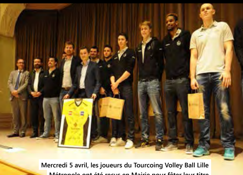
Mercredi 5 avril, les joueurs du Tourcoing Volley Ball Lille Métropole ont été reçus en Mairie pour fêter leur titre de Champions de France de Ligue B avec leurs supporters et leurs partenaires. Encore bravo à tous !