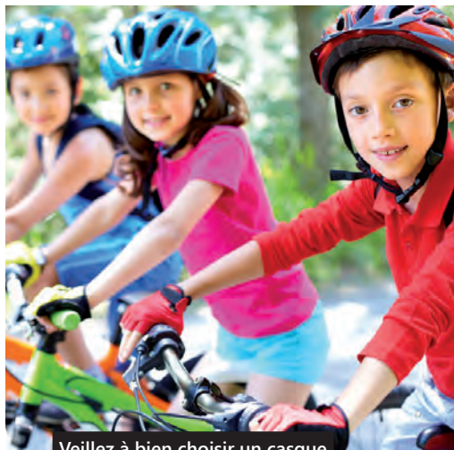
Veillez à bien choisir un casque avec la mention NF ou ECE 22/04, 22/05.

En cas de non-respect de cette obligation, un adulte qui transporte à vélo un enfant passager non casqué, ou qui accompagne un groupe d'enfants non protégés, risquera une amende de quatrième classe, c'est-à-dire de 135 €. ■