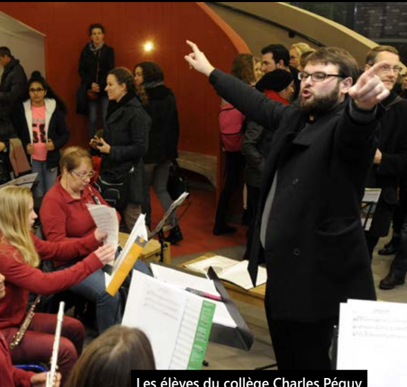
Les élèves du collège Charles Péguy ont pris part au Téléthon vendredi.