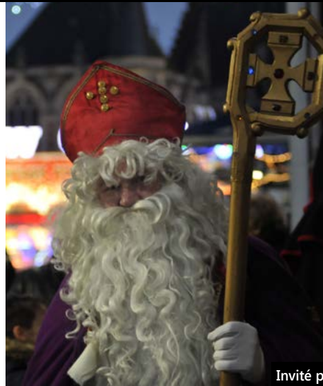
Invité par les Amis de Tourcoing et du Carillon, Saint Nicolas était de passage dans le centre-ville, samedi, accompagné de son âne.