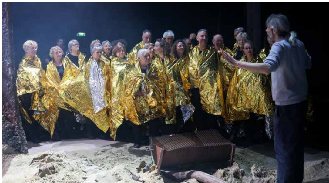
Première du spectacle « Les Naufragés » au théâtre du Nord, avec la participation de chorales de Tourcoing et du Conservatoire.

Retrouvez l'intégralité du programme du Festival de la Voix à l'adresse suivante : www.atelierlyrique-detourcoing.fr/festival-de-la-voix