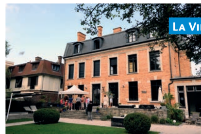
LA VILLA PAULA

www.roubaixtourisme.com - www.villapaula.fr www.villa-cavrois.fr