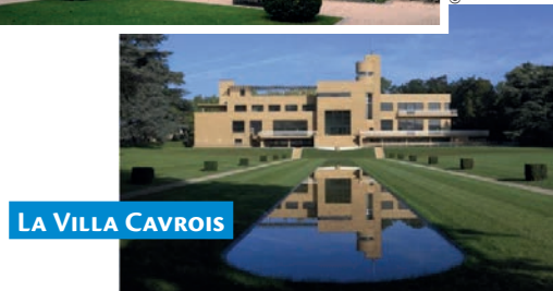
LA VILLA CAVROIS

© Robert Mallet-Stevens ADAGP © Jean-Luc Paillet - CMN